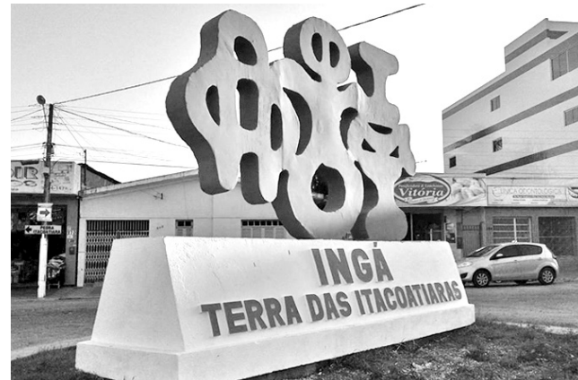
Monumento de Ingá (PB) para homenagear conjunto arqueológico