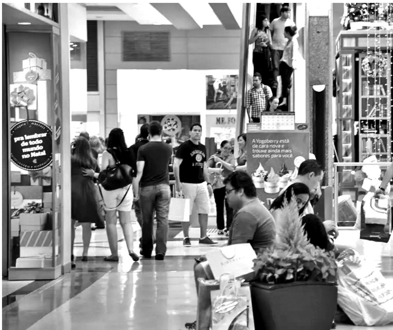
Resultado indica resiliência do setor ao longo do ano, sinalizando melhorias em alguns indicadores ao término de 2023

Na avaliação do presidente da Abrasce, Glauco Humai, o desempenho nas vendas de Natal representa um indicativo da resiliência demonstrada pelos shopping centers ao longo do ano, sinalizando melhorias em alguns indicadores ao término de 2023.