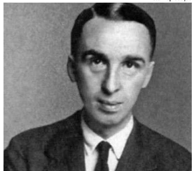
Ivanov, um dos poetas russos mais respeitados da atualidade