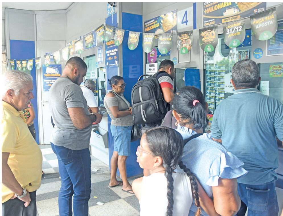
Casas lotéricas ficam lotadas de apostadores que tentam acertar as seis dezenas sorteadas

A Caixa também negou que haja identificação dos vencedores antes que eles próprios se revelem. Segundo o banco, mesmo no caso das apostas feitas on-line, o nome do apostador não fica vinculado ao bilhete eventualmente premiado. Além disso, o banco garantiu que a identidade dos vencedores é protegida pela Lei Geral de Proteção de Dados (LGPD). O banco destacou ainda que as apostas feitas pelo aplicativo da Loteria Federal ou pelo internet banking, no caso de correntistas do banco, são tão seguras quanto as feitas nas lotéricas.