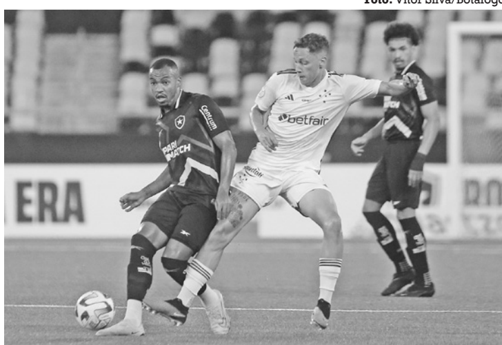
O Botafogo em jogo contra o Cruzeiro pelo Brasileiro de 2023

Na eleição para presidente da CBF, cada clube das séries A e B tem direito a um voto, as-