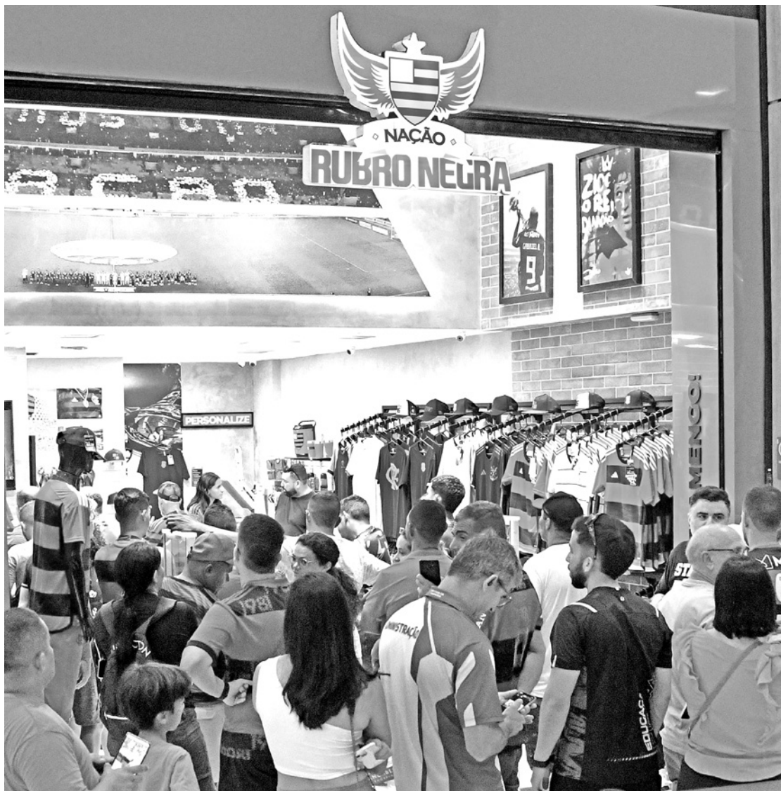
Torcedores fazem fila em busca de ingresso para o jogo entre Nova Iguaçu e Flamengo, no dia 21

“Quando o Flamengo vem jogar contra o Sport ou o Náutico eu vou assistir em Recife. Sempre que posso ir ao Maracanã eu vou. Agora, assistir em casa é outra coisa.