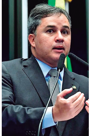
Senador Efraim Moraes

to, que varia de 1% a 4,5%, de acordo com o setor e serviço prestado.