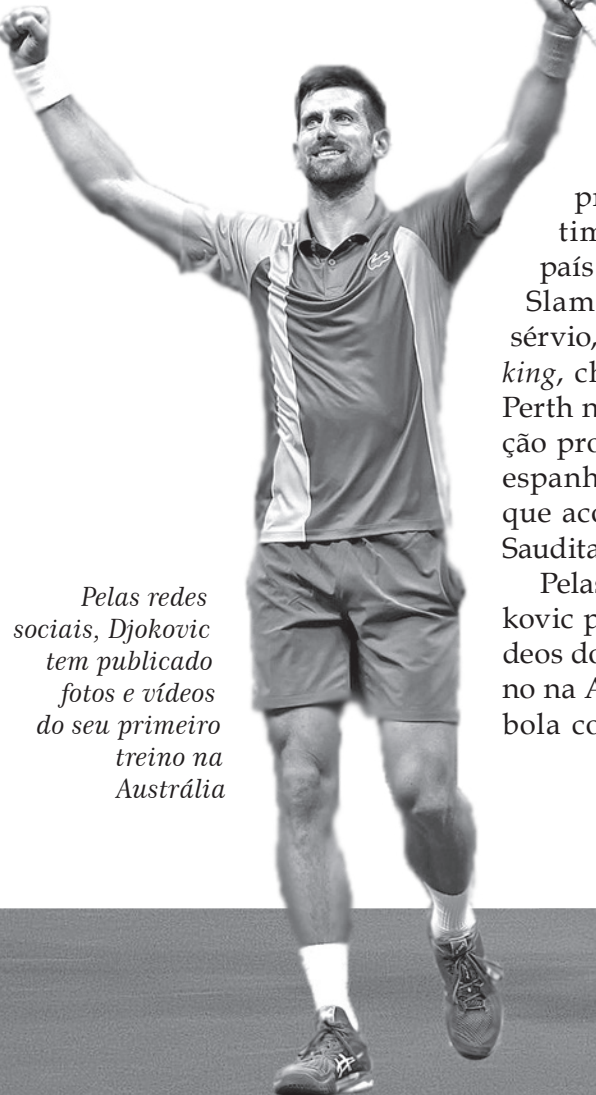
Pelas redes sociais, Djokovic tem publicado fotos e vídeos do seu primeiro treino na Austrália