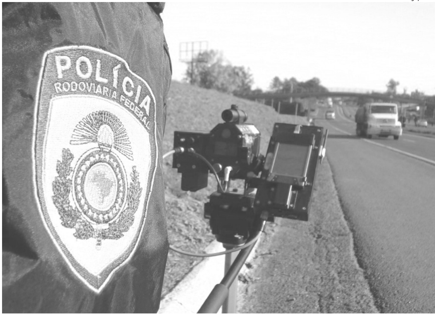
Um dos focos dos policiais é o combate à embriaguez ao volante, sexta maior causa de acidentes nas estradas federais do país

A Operação Ano Novo da PRF faz parte do Programa Rodovida que, por sua vez, é constituído pelo conjunto de ações organizadas,