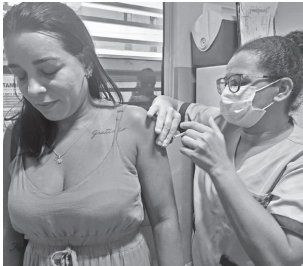
Pontos móveis ofertam todas as vacinas até as 16h

As vacinas contra Influenza e Covid-19 estão disponíveis para toda a população acima de seis meses de idade. A quarta dose da vacina bivalente contra a Covid-19 é destinada aos maiores de 18 anos, desde que tenham completado o esquema vacinal primário (duas doses ou dose única). É necessário um período de quatro meses desde a última aplicação para poder receber o imunizante. As vacinas são para pessoas acima de 18 anos, além de pessoas com deficiência, imunocomprometidas e com comorbidades acima de 12 anos, gestantes, puérperas e trabalhadores da saúde. Já a segunda dose de reforço é apenas