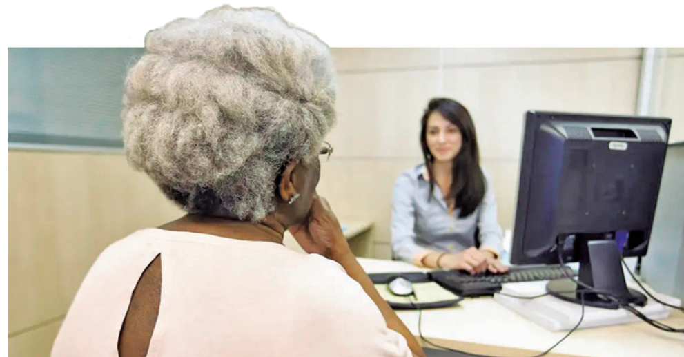
Em 2024, para as mulheres, são necessários 91 pontos e pelo menos 30 anos de contribuição

Se a notificação ocorrer após o 50º dia, será considerada válida se for garantido, pela operadora, o prazo de dez dias, contados da notificação, para que seja quitado o débito. Mas, a operadora deverá comprovar a notificação do consumidor sobre a inadimplência, com a respectiva data da notificação.