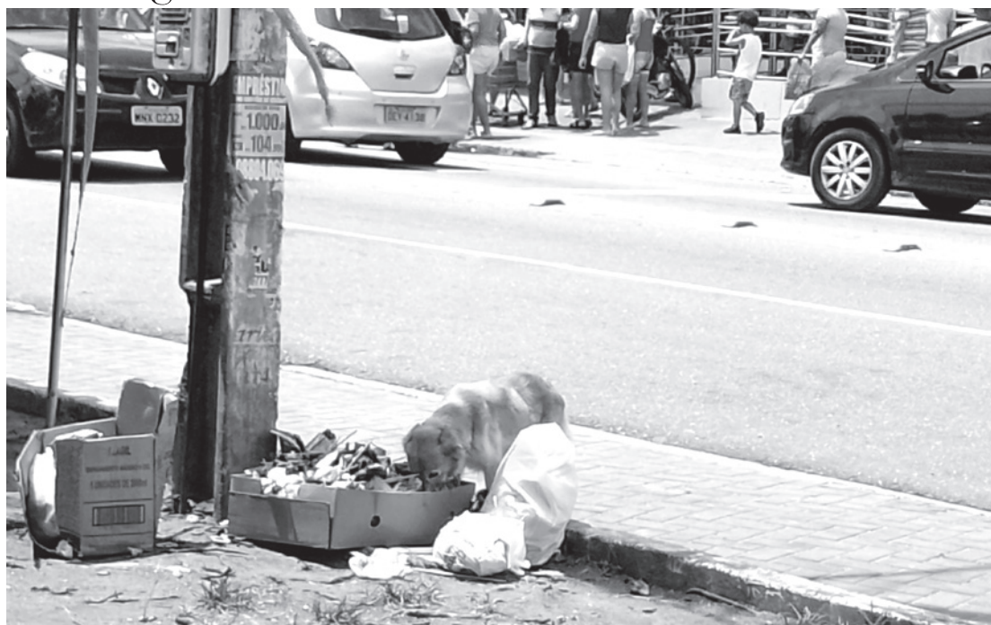
Fome que não dá trégua