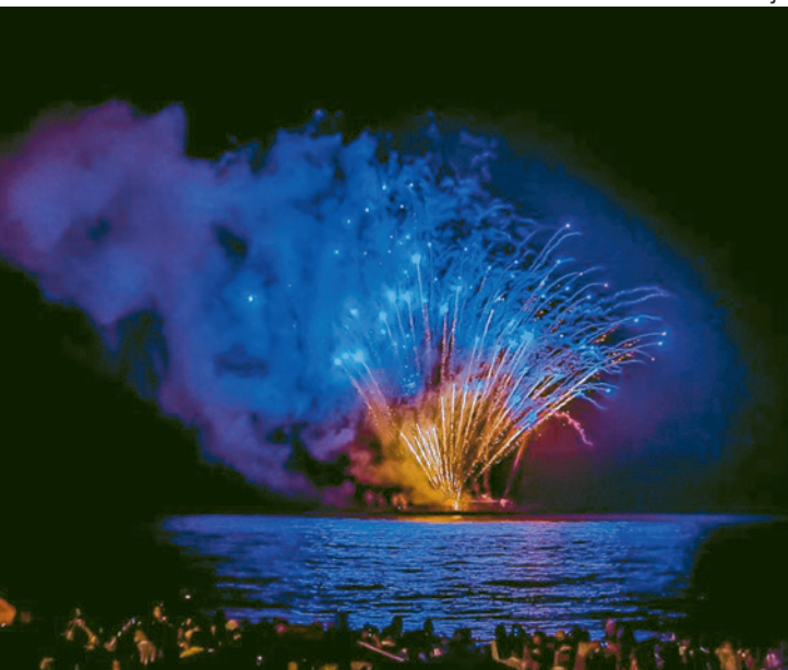
Registro de ocupação no final de semana supera a média de dezembro

Não há quase leitos disponíveis na rede hoteleira de João Pessoa para este final de semana de virada de ano até a próxima segunda-feira. Conforme dados da Associação Brasileira da Indústria Hoteleira - Seccional Paraíba (Abih-PB), a previsão de ocupação está próxima a 100%. Já para a média de ocupação no mês de dezembro, a perspectiva é de que supere os 70%. A rede hoteleira de João Pessoa tem cerca de 10 mil leitos.